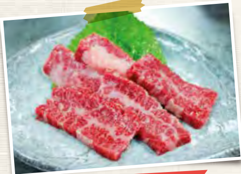
牛バラ旨味カルビ